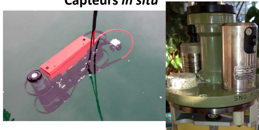
Capteurs in situ