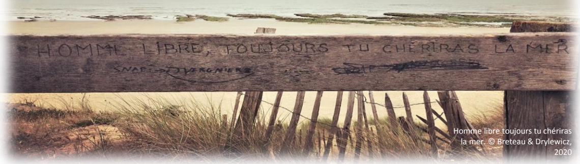
Homme libre toujours tu chériras la mer. © Breteau & Drylewicz, 2020

> JEUDI 18 JUN 2020, 16H (PARIS), 10H (ANTILLES)