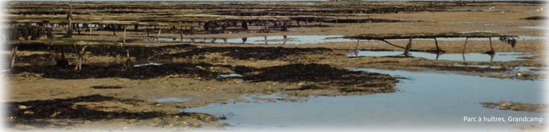
Parc à huîtres, Grandcamp

> JEUDI 7 MAI 2020, 16H (PARIS), 10H (ANTILLES)