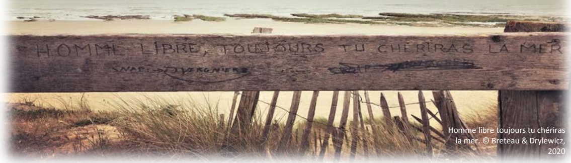
Homme libre toujours tu chériras la mer.

> JEUDI 18 JUIN 2020, 16H (PARIS), 10H (ANTILLES)