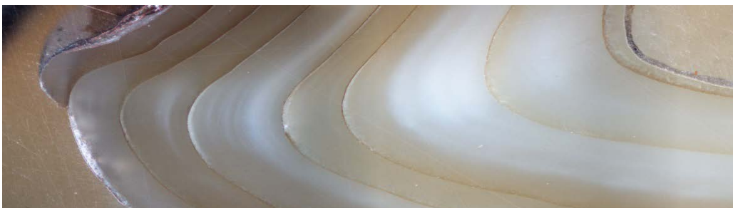
Couches de croissances dans une coupe transversale d'une coquille de bivalve Anodontites sp.

par Claire Lazareth , chargée de recherche, équipe SOMAQUA, IRD