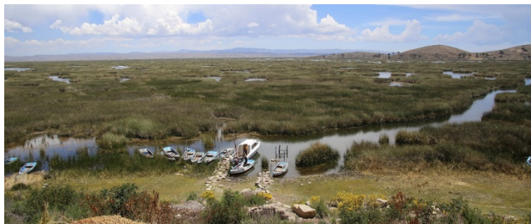
Petit Lac du Titicaca, Baie de Cohana.

PhD Ecologue lacustre IRD/BOREA @ IE-IIGEO/UMSA, Campus de Cota Cota, Calle 27 s/n, La Paz xavier.lazzaro@ird.fr , +(591) 72 02 68 79 Coordinateur du projet pilote PNUD/GEF OLT 05-B-05, https://olt.geovisorumsa.com/