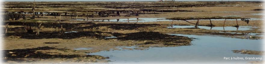
Parc à huîtres, Grandcamp

> JEUDI 7 MAI 2020, 16H (PARIS), 10H (ANTILLES)