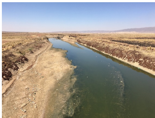
Rivière Katari sur l'altiplano en bordure du Lac Titicaca (Bolivie). La gestion de l'eau une nécessité absolue pour les populations et l'environnement.

par Marc Pouilly , chargé de recherche, équipe SOMAQUA, IRD