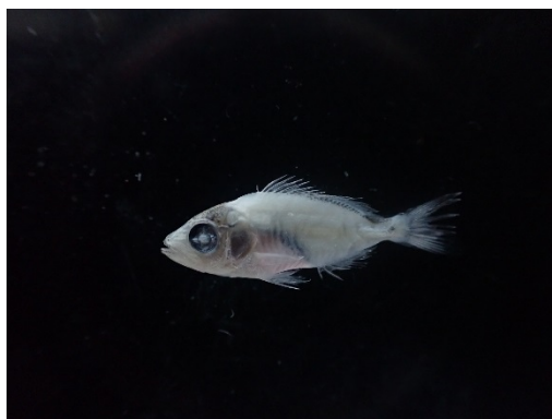
Jeune recrue collectée lors du projet DIDILAC.

par Charlotte Dromard , maître de conférences, Équipe RECAP, Université des Antilles