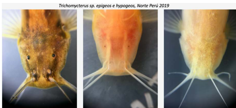
Têtes de Trichomycterus sp issus de population épigée (gauche) et hypogées (centre et droite)

par Gaël Denys , chercheur contractuel, équipe BIOPAC, UMS Patrinat, MNHN