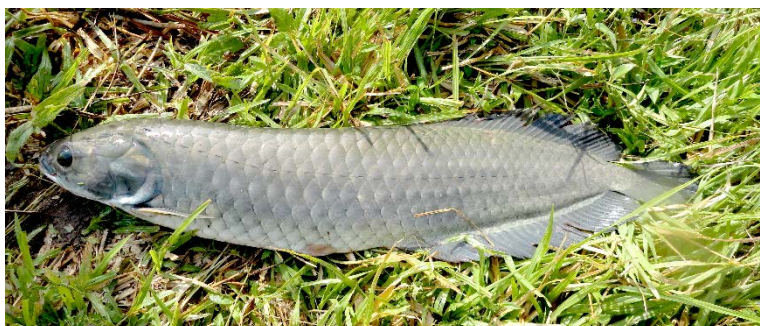
Heterotis niloticus adulte, Lt = 65 cm.

par Jésus Nuñez chargé de recherche, équipe PHYPAQ, IRD