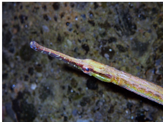
Oostethus brachyurus .

par Vincent Haÿ , doctorant, équipe BIOPAC, Sorbonne Université