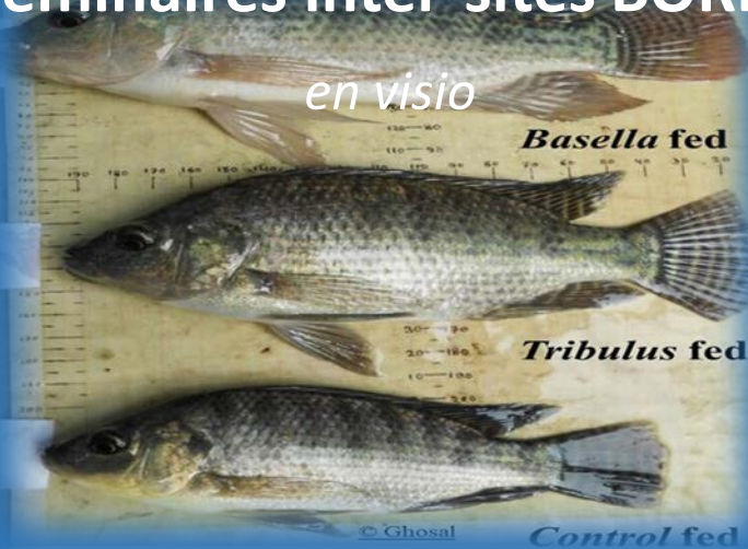
Plant extract fed sex reversed male tilapia

> JEUDI 8 DÉCEMBRE 2022, 16H (PARIS), 11H (ANTILLES)